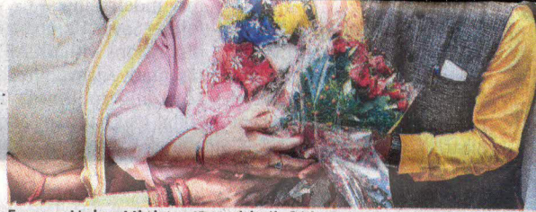
Former Union Minister JP Nadda (left) being greeted on his arrival Tuesday after being appointed as the new working President of the

Mallikarjun Kharge was the leader of the Congress in the previous Lok Sabha but he lost the election this time, forcing the party to decide on another name.